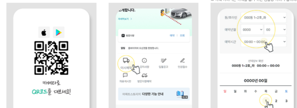
01. QR코드 또는 스토어(플레이/앱스토어)에서 "아파트스토리"를 검색한 후 설치 02. 로그인 후 이사예약 퀵메뉴를 눌러서 페이지 이동 03. 정보 전부 선택 후 달력에서 희망날짜 선택